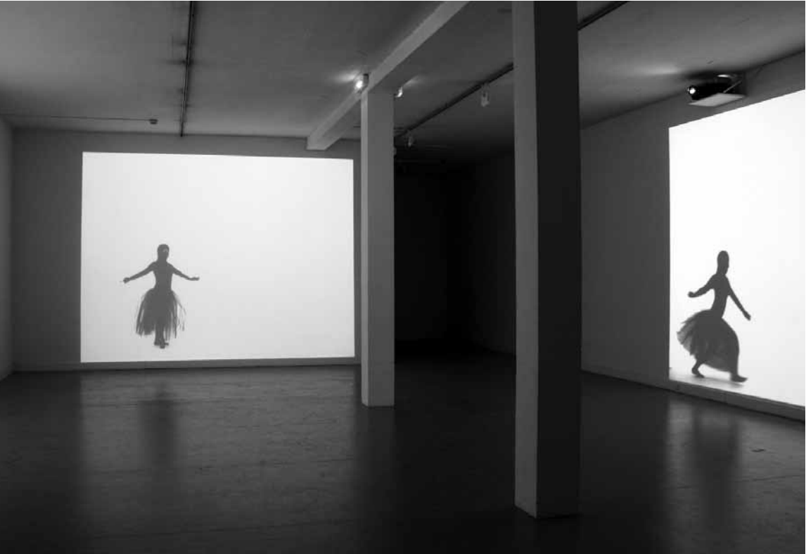
Installation view of Faces in the Crowd, 2005, at the Whitechapel Art Gallery, London

juste une prise en compte alchimique des métamorphoses qu’il occasionne. Cela a pu se manifester lors d’expositions précédentes par le spectacle de la lente décomposition d’éléments périssables (gélatine alimentaire, substances organiques, lait corporel…) ou, comme c’est le cas ici, par le coup d’arrêt prononcé par l’irruption violente de la mort ou de son symbole ou encore par le temps remémoré du souvenir. Quand bien même ce dernier serait revé ou provoqué – car les œuvres de Boudier flirtent toujours avec cette autre limite, celle du factice, de la pacotille ou de la plaisanterie – cela ne mettrait pas en doute la véracité de son apparition, elle-même souvent mêlée d’expériences présentes ou passées. Du vrai faux qui articule une cosmogonie personnelle et rapproche l’art d’une expérience intime.