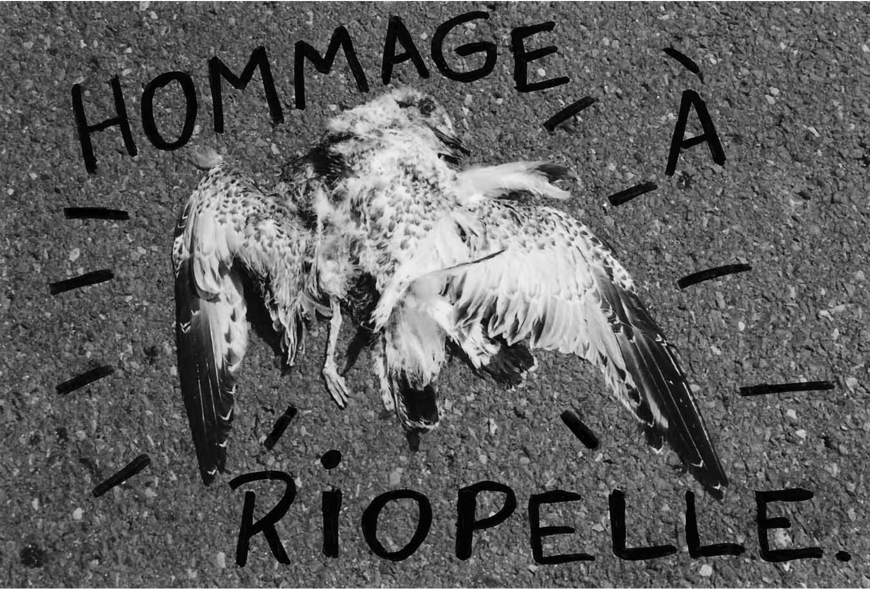
QJQISTES, HOMMAGE À RIOPELLE, DÉTAIL DE L'INSTALLATION BALADE AU CŒUR DE LA VÉRITÉ DE L'ART, 2005