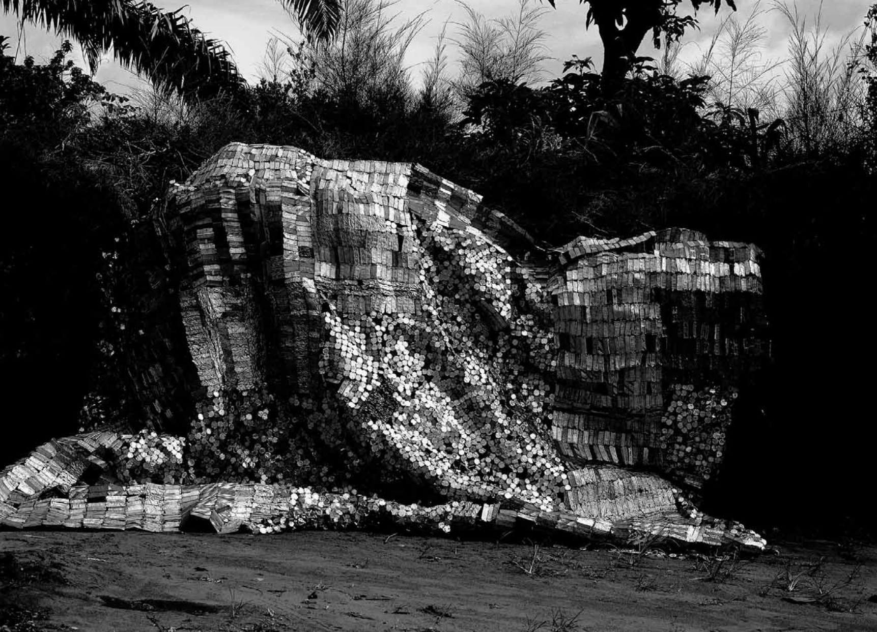
EL ANATSUI, SASA (VUE DE L'INSTALLATION), 2004, ALUMINIUM, FIL DE CUIVRE, 840 x 640 CM

Mori Art Museum | Tokyo | avril – juin 2006