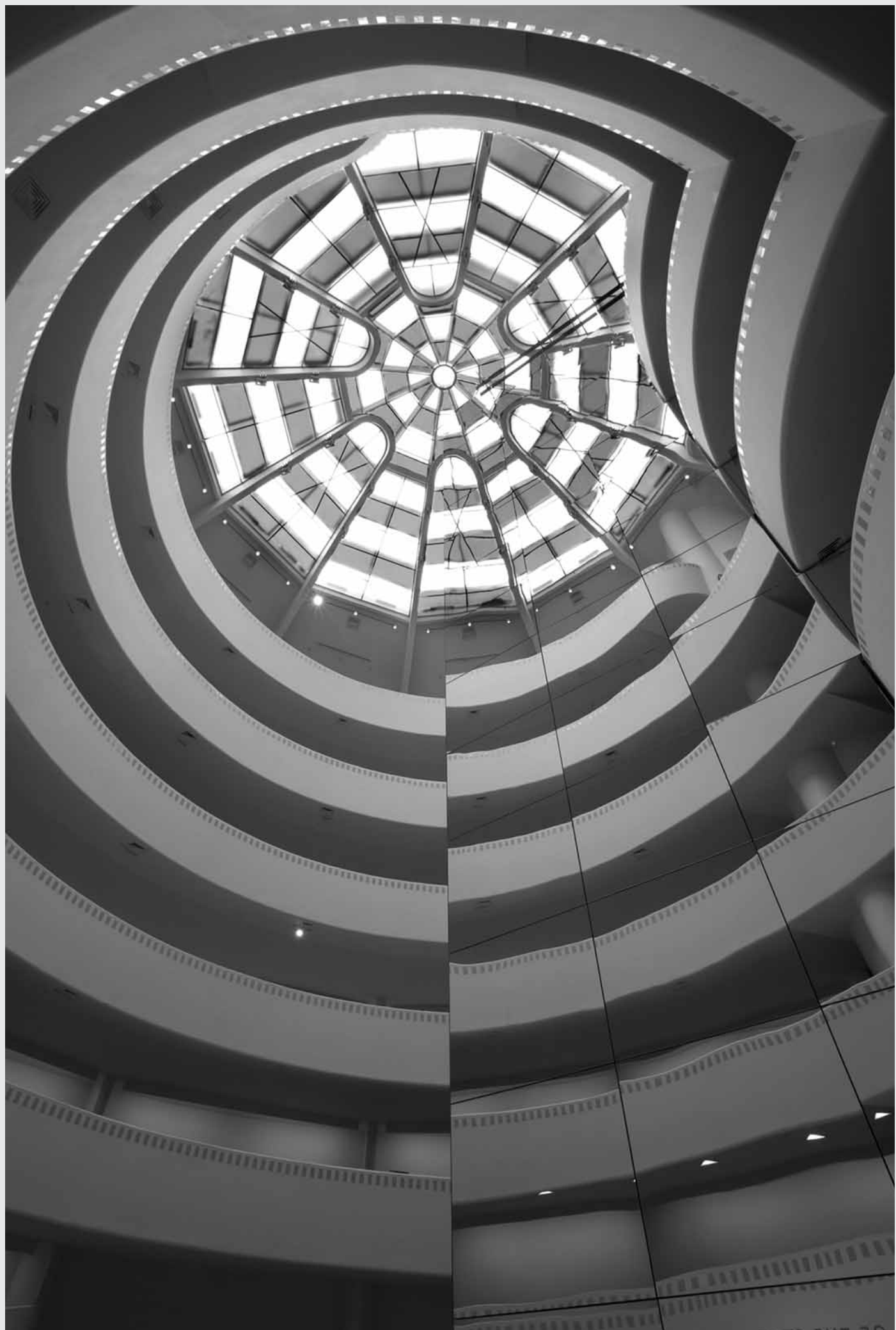
CLAIRE SAVAIE, Qui se tient sur les lèvres (VUE PARTIELLE), FIBRE DE BOIS, MDF, ENCEINTES ACOUSTIQUES, MONITEUR, LECTEURS CD, LECTEUR DVD, VIDÉOGRAMME COULEUR, SONORE ET BANDES SONORES 250 x 835 x 835 cm

L'auteur poursuit des études de second cycle en histoire de l'art. Elle vit et travaille à Montréal. beaupre.marie-eve@courrier.uqam.ca